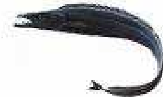
Le sabre noir 8

Peut mesurer jusqu'à 110 cm. Son espérance de vie atteint les 32 ans et sa maturité est fixée à l'âge de 7 ans. Son milieu de vie naturel se situe entre 200 et 1 700 m de profondeur.