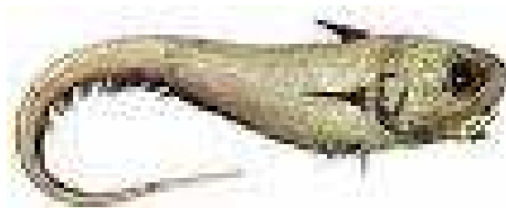
Le grenadier de roche 9

Peut mesurer jusqu'à 110 cm. Son espérance de vie atteint les 32 ans et sa maturité est fixée à l'âge de 7 ans. Son milieu de vie naturel se situe entre 200 et 1 700 m de profondeur.